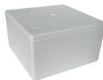
CASSETTA IN POLISTIRENE PS 6