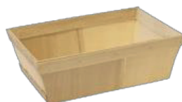
CASSETTA IN LEGNO FOR 50