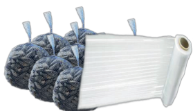
FILM ESTENSIBILE IMBALLAGGIO BANCALI LDPE 4