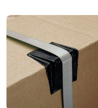
REGGETTA IN PVC PP 05