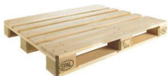
BANCALE IN LEGNO FOR 50