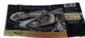
COPERCHIO IN LEGNO FOR 50 CON FOGLIO DI CARTA RESISTENTE ALL'ACQUA C/PAP 81