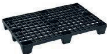
BANCALE IN PLASTICA PP 05