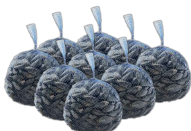
SACCHI MOLLUSCHI IN POLIETILENE LDPE 4