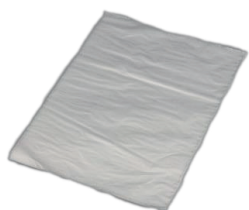
FOGLIO SEPARATORE IN POLETILENE LDPE 4